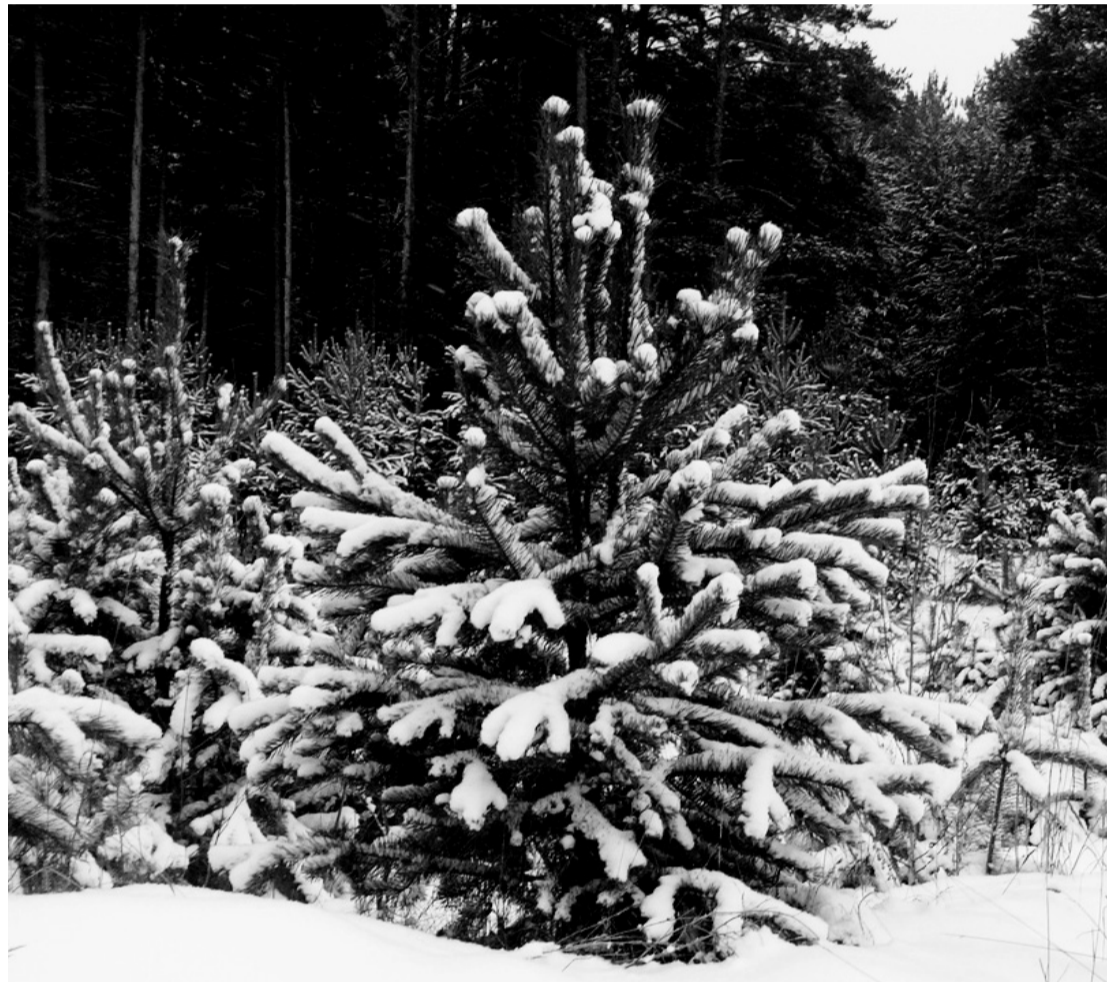
• А можно пушистую красавицу украсить в лесу и возле неё встретить Новый год.

Лесники и сотрудники ГИБДД округа в ожидании праздника весь месяц будут контролировать перевозки круглого леса и новогодних елей.