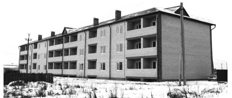
• Дом на улице Профсоюзной ждёт новосёлов.