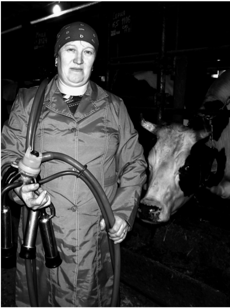
• Её Пенсия, Пестрянка и Выюга сегодня тоже в передовиках.