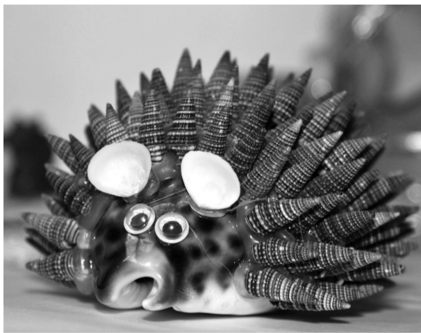
• Выставка «Ежиная семейка» будет работать в краеведческом музее до конца июля.