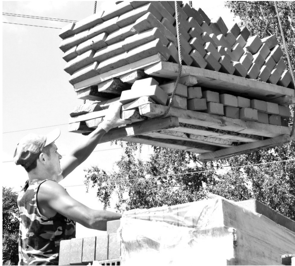
• Большинство несчастных случаев на производстве – результат несоблюдения техники безопасности самими работниками.