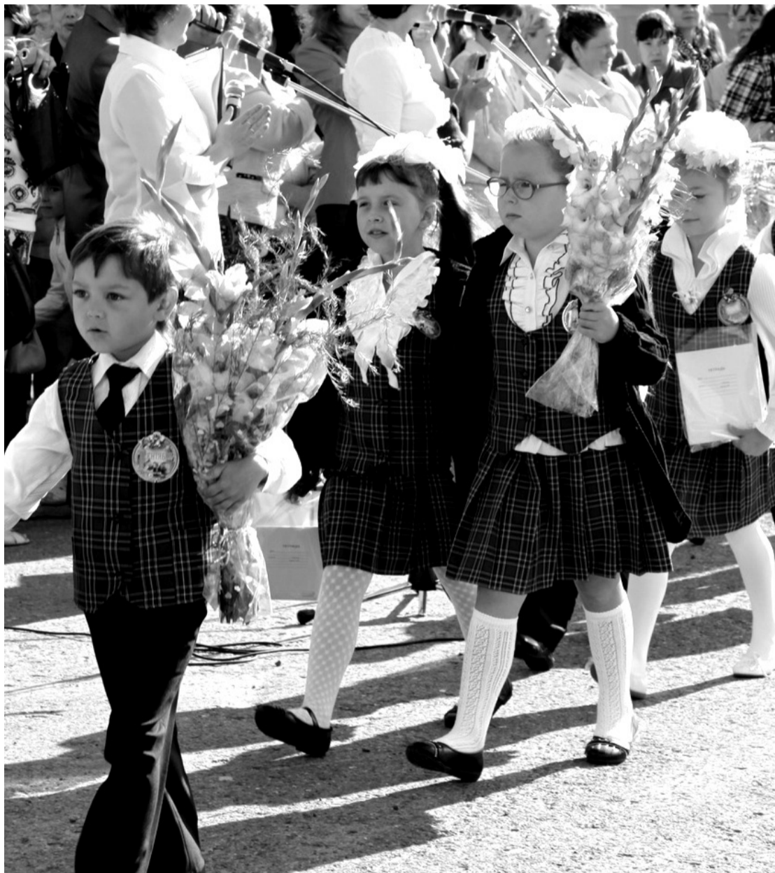
• Школьная форма и украшает, и дисциплинирует.

В связи с вступлением в силу с 1 сентября 2013 года закона «Об образовании в Российской Федерации» во всех школах страны для учащихся вводится школьная форма.