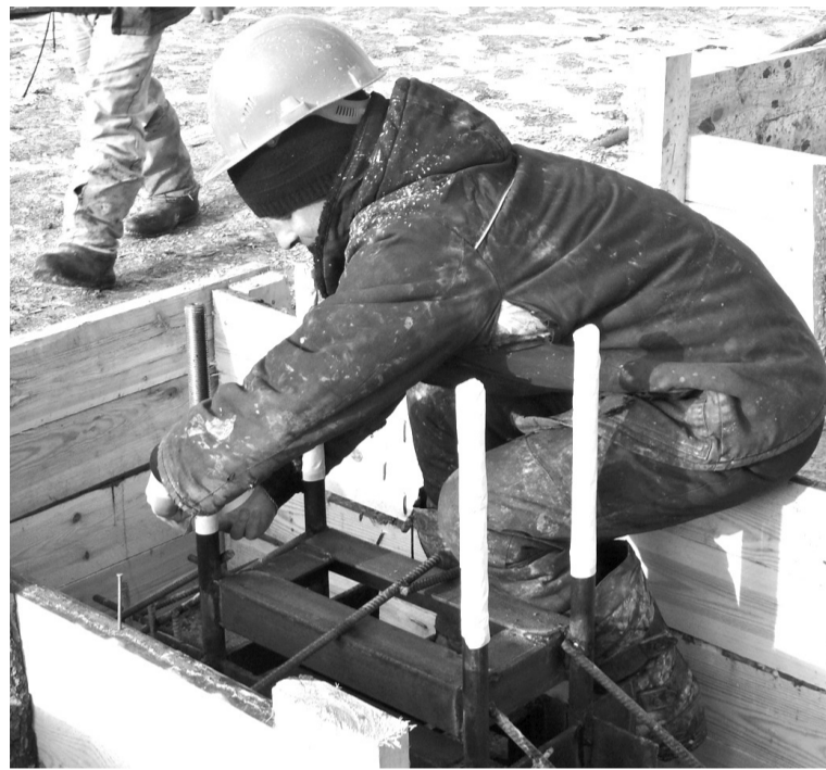
• Быть фундаменту прочным!