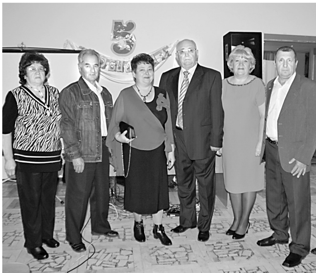
• Много нас, мы разные, но живём здесь как одна семья.