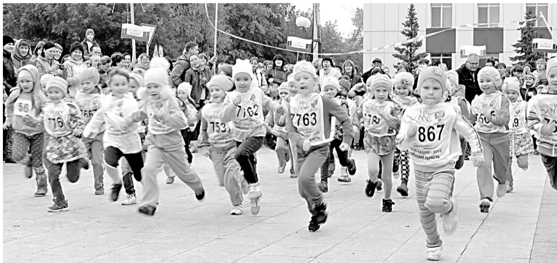
• Первыми на дистанцию вышли дошколята.