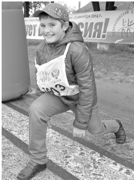
• Разминка перед стартом.

Руководители предприятий и организаций окру-