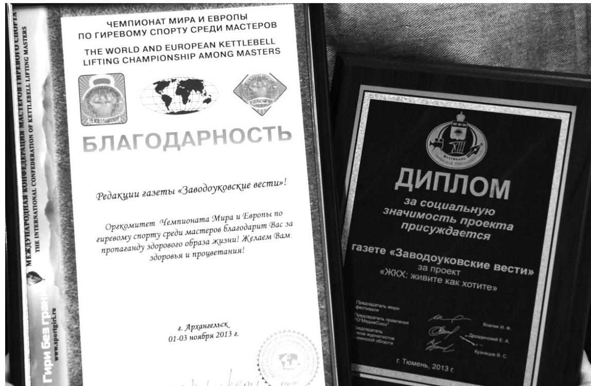
• Награды 2013 года: диплом фестиваля «Тюменская пресса – 2013» и благодарность из Италии от президента Международной конфедерации мастеров гиревого спорта.