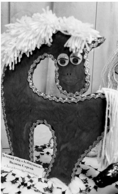
• Загадочная лошадка Сергея Волкова.