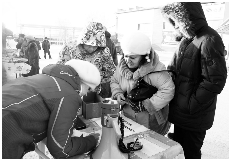
• Минус 30. Мороз подписке не помеха.

Что для газеты главное? Конечно же, читатель, поэтому в начале года мы с нетерпением ждём информации от почтovieков о количестве подписчиков.