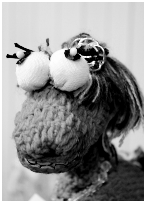
• Лола-2014 Ульяны Торшняк.