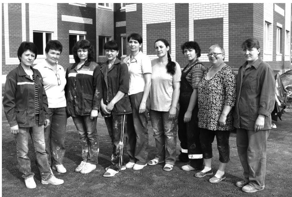
• Отделочницы – художницы стройки.

Несмотря на то, что все трудятся в заданном режиме, я бы отметил бригаду каменщиков. Отлично трудятся ребята, качественно выполняют свою работу! И конечно нельзя не назвать отделочниц, молодцы! Умело держат они в руках инструменты!