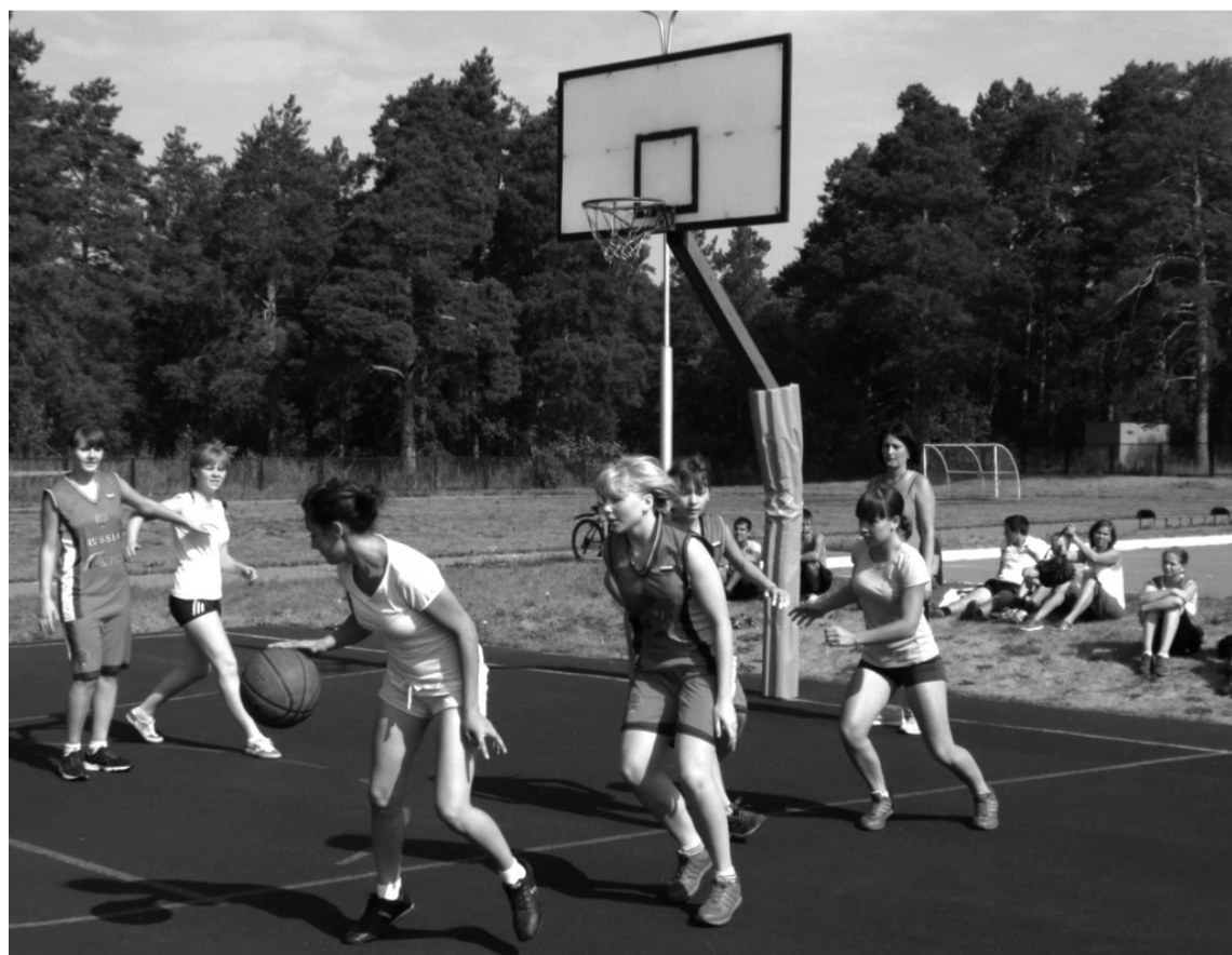
• На площадке женская сборная.