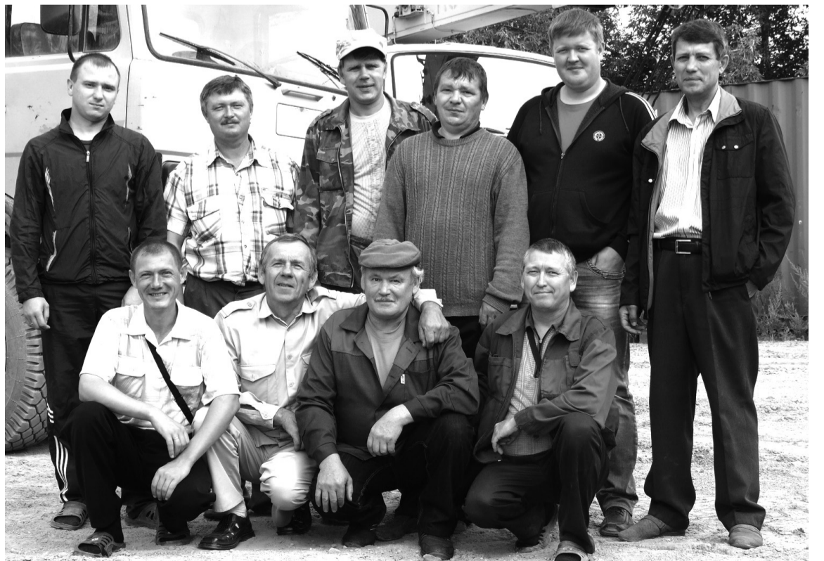
• Состав водителей невелик, к тому же с утра пораньше часть их была уже в дороге. Но на КСМ привыкли обходиться не числом, а умением.