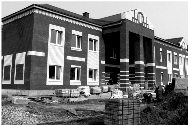
• Красавица школа в Вагае.

В центре села Вагай Омутинского района строители-загросовцы возводят двухэтажную кирпичную школу.