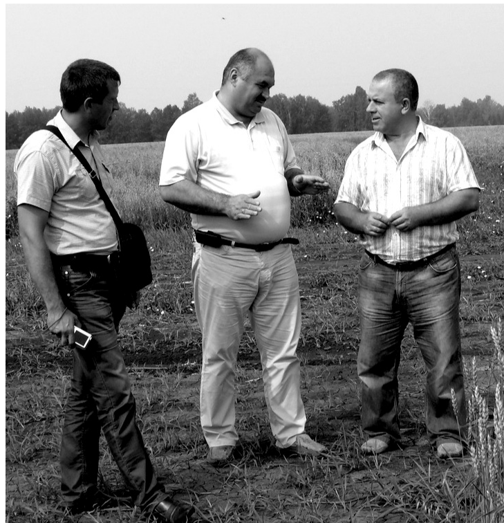
• У каждого своё мнение.