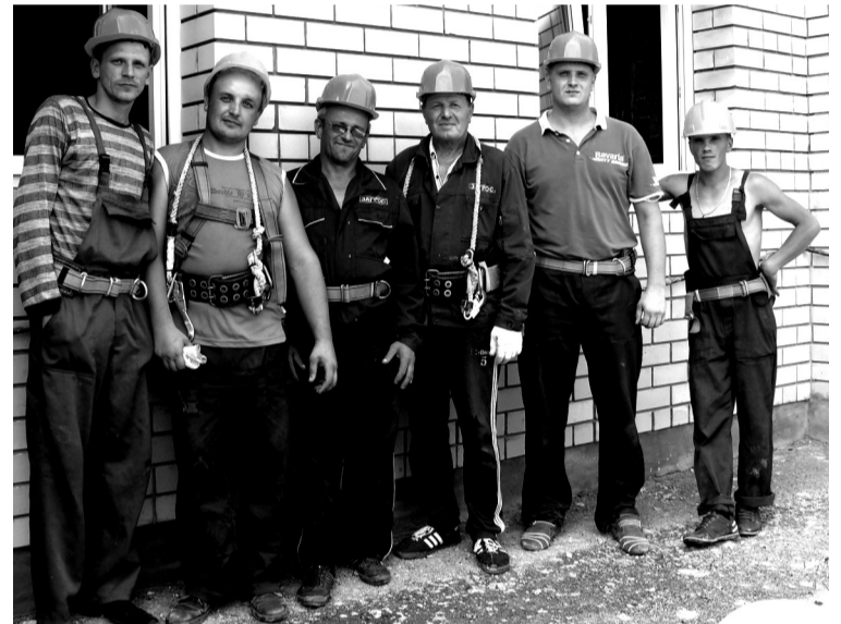
• Жестянщики готовы к работе.