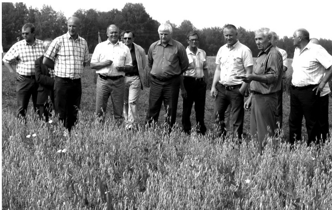
• Делегация на полях крестьянского хозяйства «Дружба».