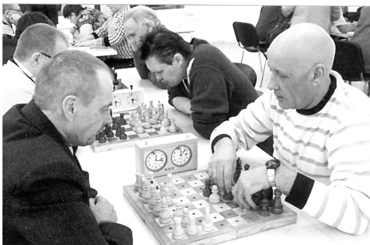
• Мы начинаем и выигрываем.

– Хорошо, что мы есть! Нам бы только не засиживаться в своих квартирах, чаще собираться вместе и ещё крепче держаться друг за друга. И хоть сегодняшнюю дату праздником не назовёшь, желаю всем людям здоровья и терпения. Берегите друг друга!