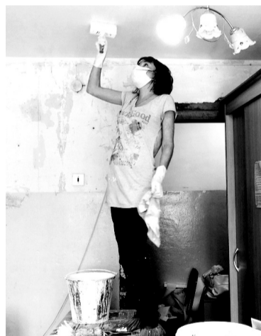
• Ремонт в разгаре.