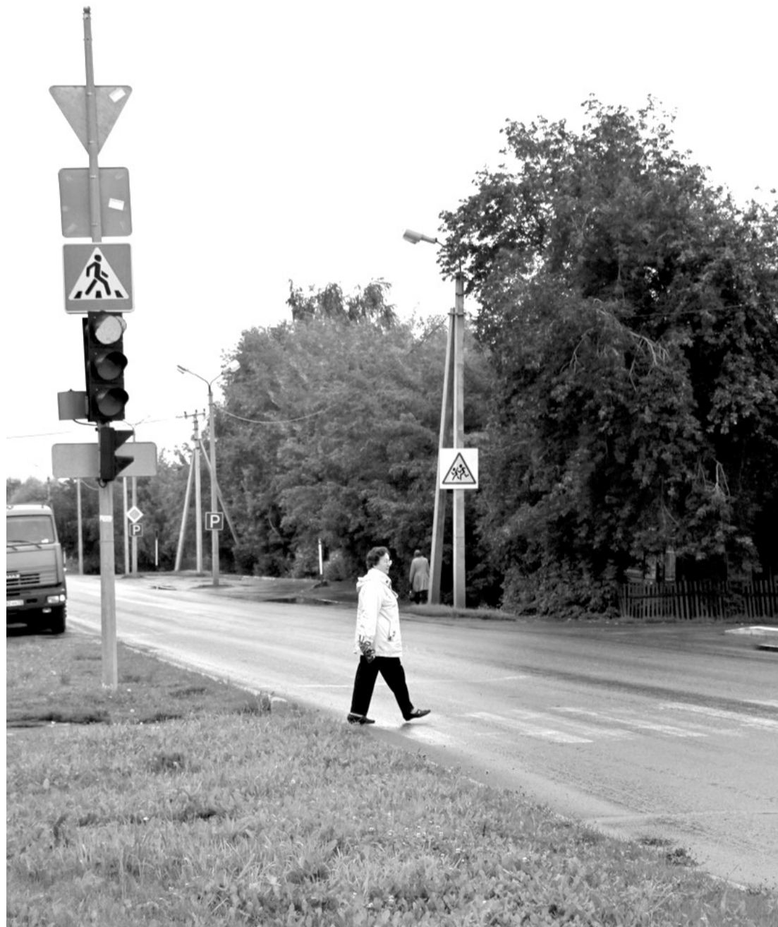
• Семь перекрёстков в нашем городе оборудованы светофорами, позволяющими регулировать поток машин и пешеходов.

Первый электрический светофор появился в 1912 году в США. А до нашей страны дошла очередь 15 января 1930 года. Автоматически работающие светофоры установили в Ленинграде, а к концу года и в Москве.