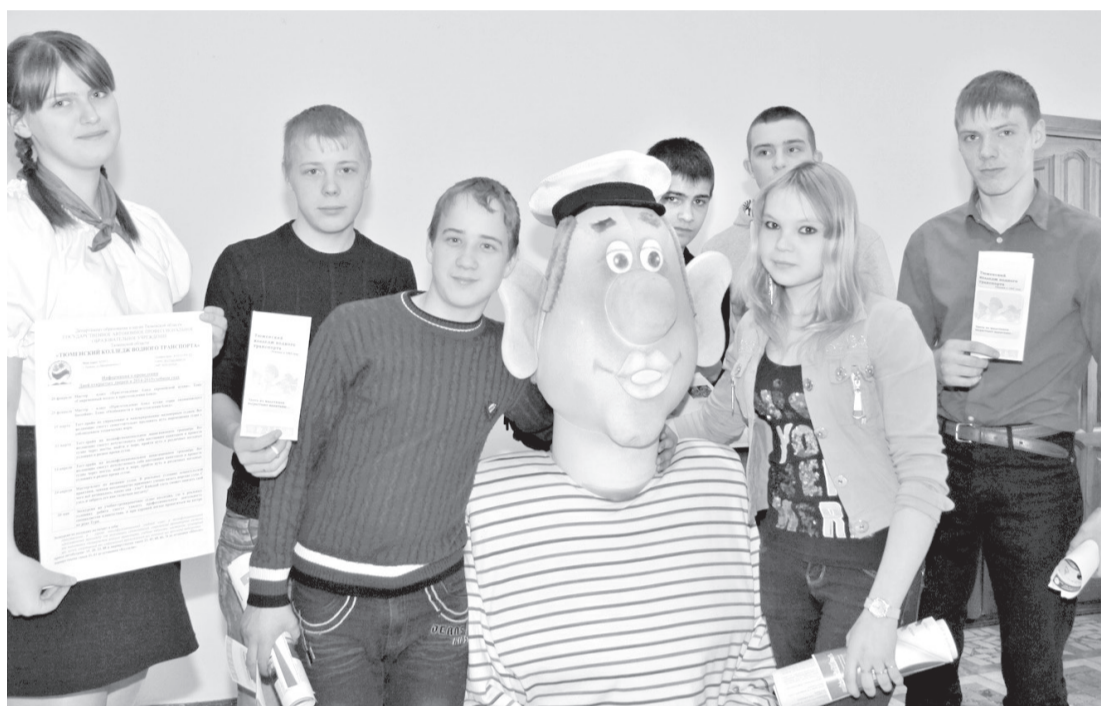
• Студенты Тюменского колледжа водного транспорта креативно прорекламовали свой ссуз: двухметровая ростовая кукла-морьяк вмиг собрала вокруг себя абитуриентов.

Куда пойти учиться? Выбрать высшее или среднее специальное учебное заведение? На эти и другие вопросы старшеклассники городского округа получили ответы на традиционной ярмарке учебных мест.