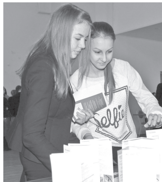
• На ярмарке учебных мест школьники могли пройти профессиональную диагностику по системе «Ориентир».