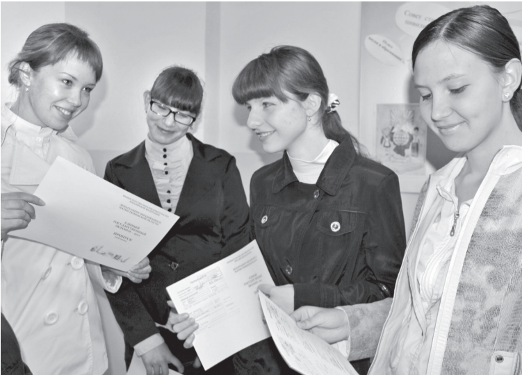
• Чтобы получить допуск к ЕГЭ, нынешние выпускники уже написали зачётное сочинение.

Первого февраля завершился приём заявлений от выпускников школ на участие в едином госэкзамене. В этом году одиннадцатиклассникам пришлось определиться с выбором предметов на месяц раньше.