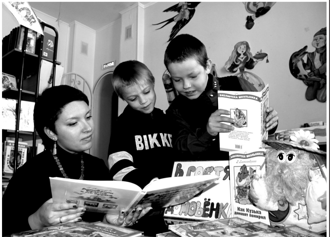
• Как хорошо любить читать.

В Заводоуковске впервые прошла «Библионочь». Социально-культурную акцию поддержали почти все российские города. Наши библиотекари подготовили для своих читателей яркую и разнообразную программу.