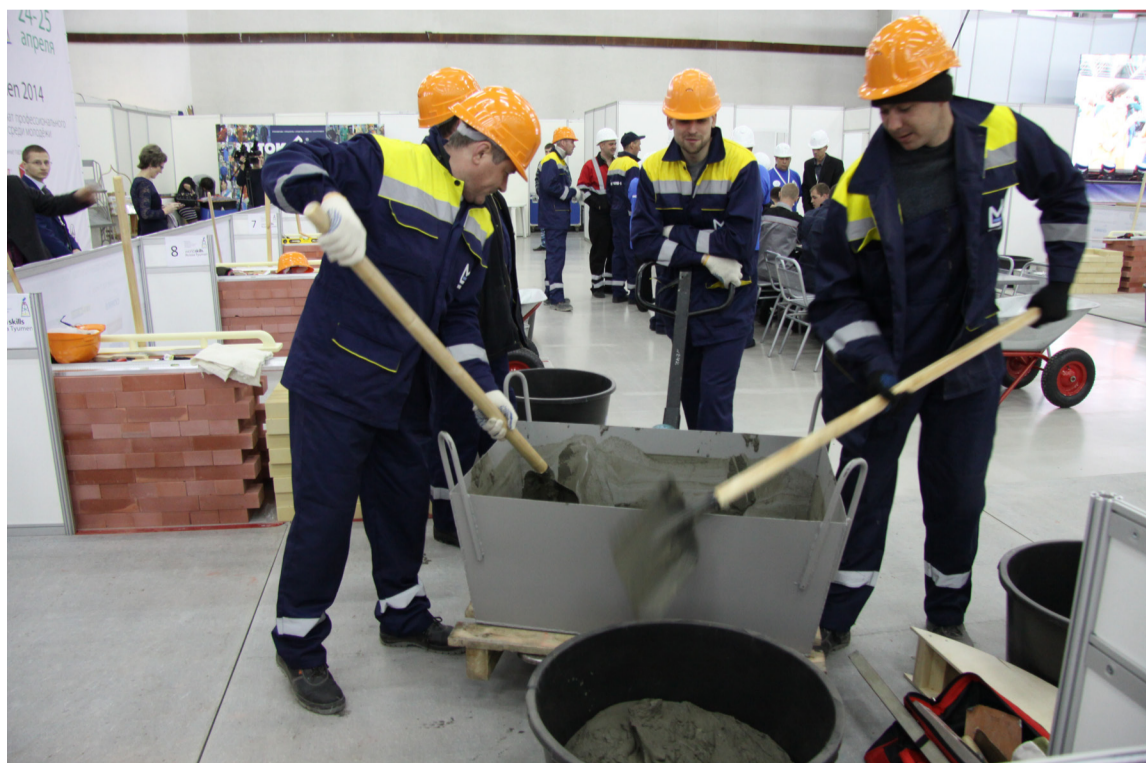
• Работающая молодёжь и студенты из Тюмени защитили честь области в финале чемпионата в Казани. Лучшие из них поедут летом на состязания в Бразилию.