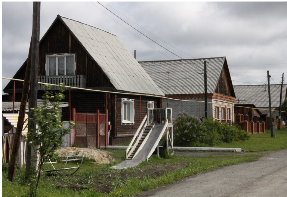
• На улице Алтайской чистота и порядок.