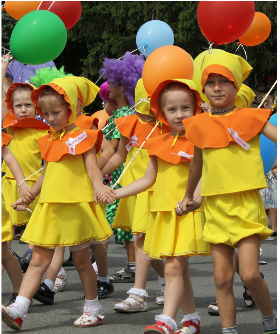
• «Детство моё, постой, погоди, не спеши. Дай мне ответ простой, что там впереди...».

Заводоуковская детвора встречает лето. Завтра на центральной площади города мальчишек и девочек ждёт обширная развлекательная программа.