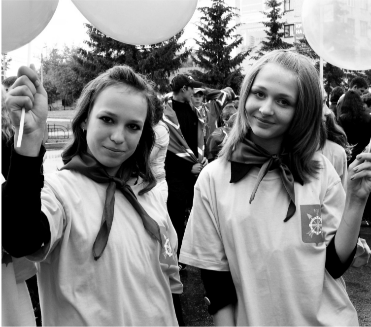
• Наши руки не для скуки!

В этом году специалисты центра занятости населения заключили договоры с 20 организациями и предприятиями округа и обеспечили работой 807 подростков. Более сотни рабочих мест выделили работодатели внебюджетного сектора экономики.