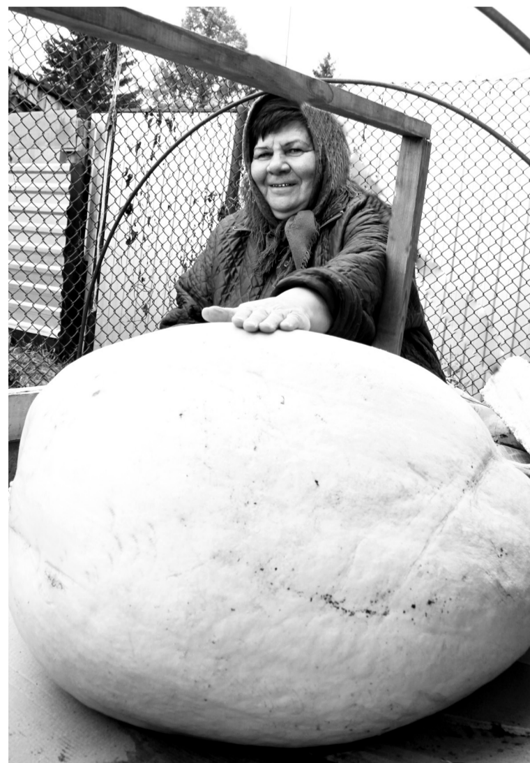
• Вот она, необыкновенная тыква!