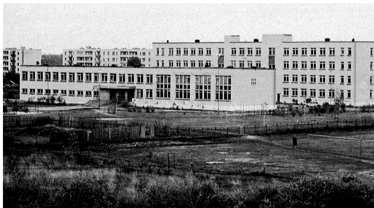
• Средняя школа № 2, 1973 год.

Ольга МЯСНИКОВА