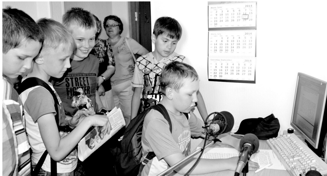
• Смелычаки решили попробовать себя в роли радиоведущих.