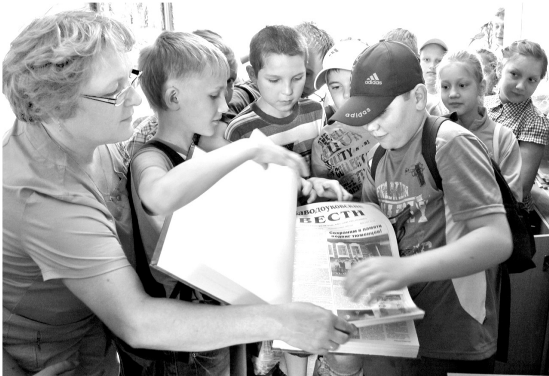
• Попасть в прошлое Заводоуковска детям помогли страницы районки.

В том, что школьники – народ любопытный, мы, сотрудники районки, в очередной раз убедились, встречая на пороге редакции шумную ватагу ребят из лагерей дневного пребывания.