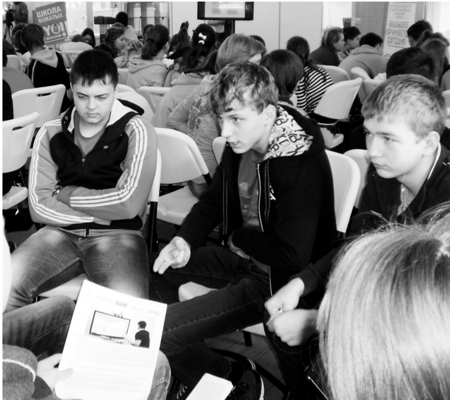
• Обсуждаем IT-проект.

Более двухсот российских школьников, не мыслящих себя без компьютерных технологий, собрались в детском оздоровительном центре Анапы на профильную смену «Начни IT». В её работе впервые участвовали и старшеклассники нашего округа.