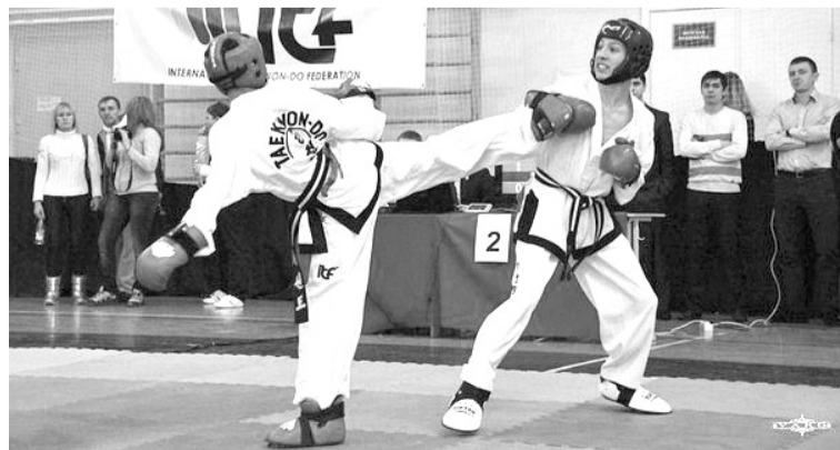
• Характерная особенность тхеквондо – ноги в поединке используются активной, чем руки.