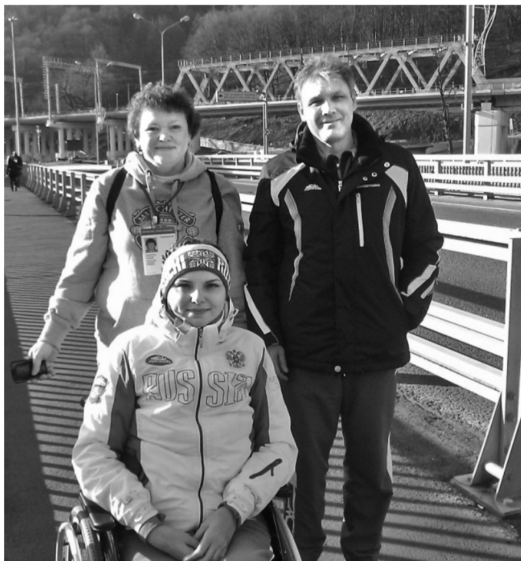
• Безбарьерная среда в Сочи повсюду: от вокзала до Красной Поляны.

Поездка на домашние зимние Паралимпийские игры для заводоуковских болельщиков – событие незабываемое. Они в один голос утверждают, что на всю жизнь запомнят невероятный драйв и бешеную энергетику Сочи.