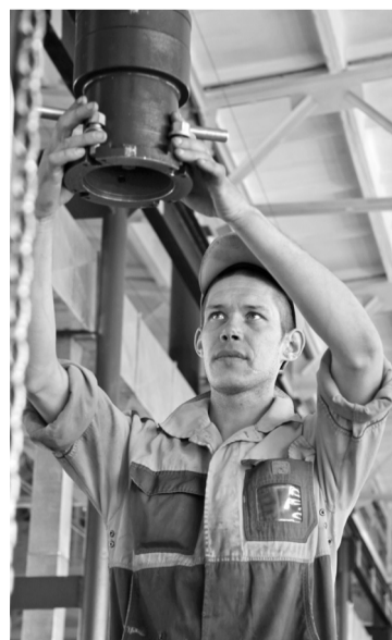
• Труд должен быть безопасным!