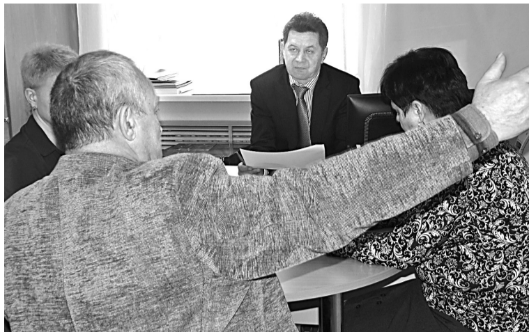
• Посетитель: «Да я ведь не за себя прошу!»