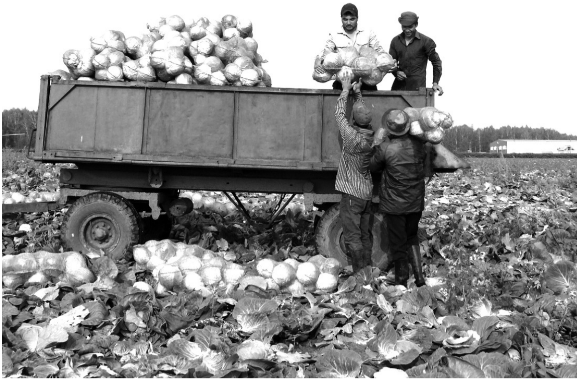
• Капуста пойдёт потребителям.

По данным комитета по сельскому хозяйству и продовольствию, на 2 августа заготовлено 3969 тонн сена, что составляет 91% запланированного. Заложено зелёной массы на сенаж 23,4 тысячи тонн (41% плана).