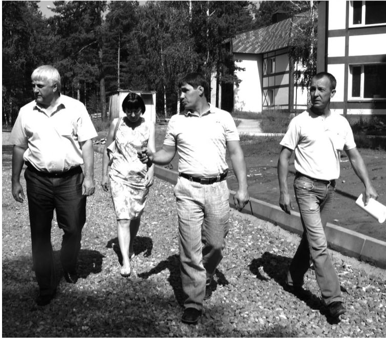
• Ждём твоего открытия, «Ингала».