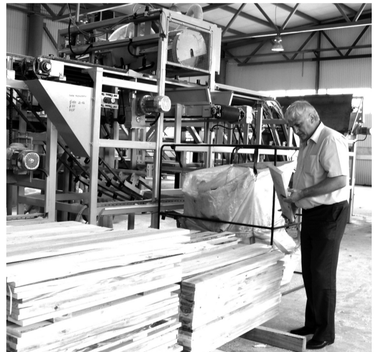
• Досочки – на загляденье!