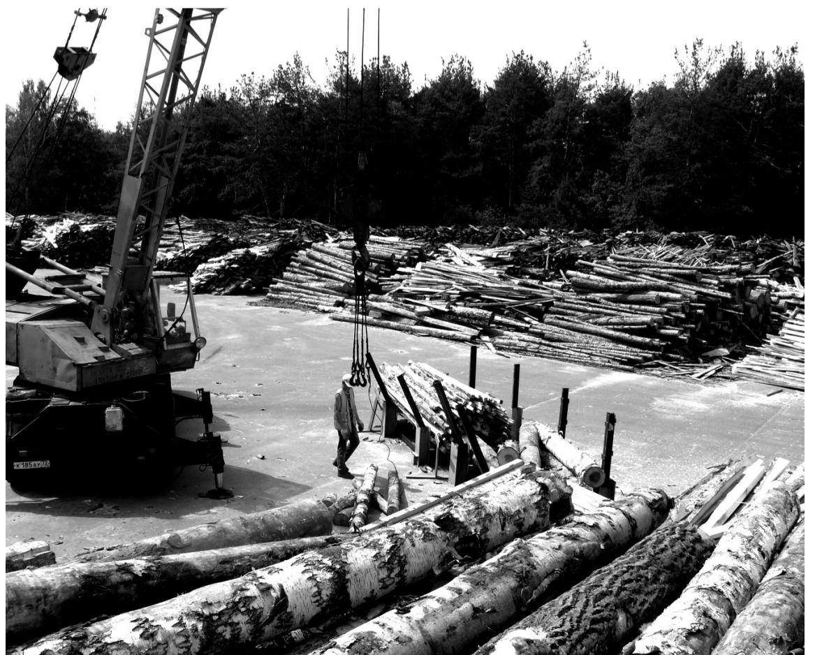
• И берёзу в дело.