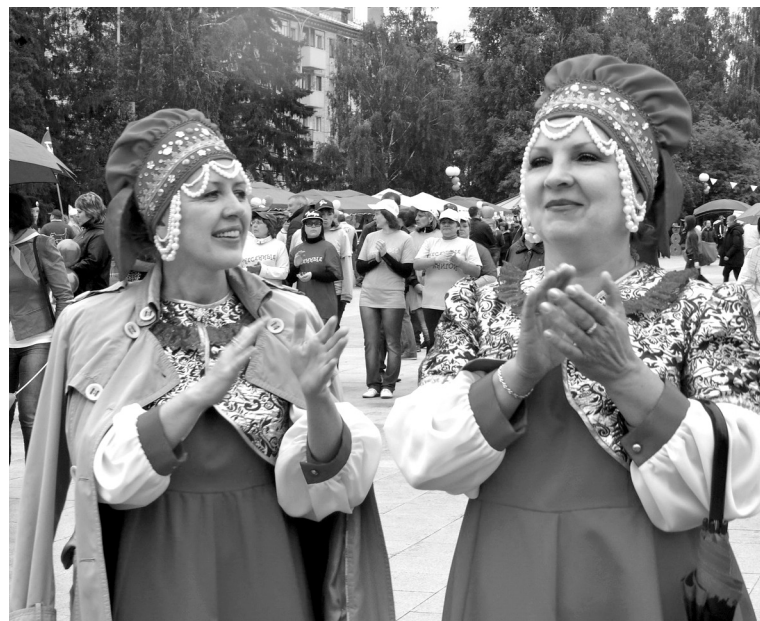
• Над площадью звучали народные песни.