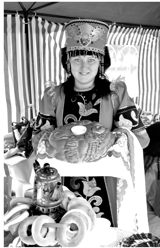
• Заводоуковцев и гостей праздника по традиции встречали хлебом-солью.