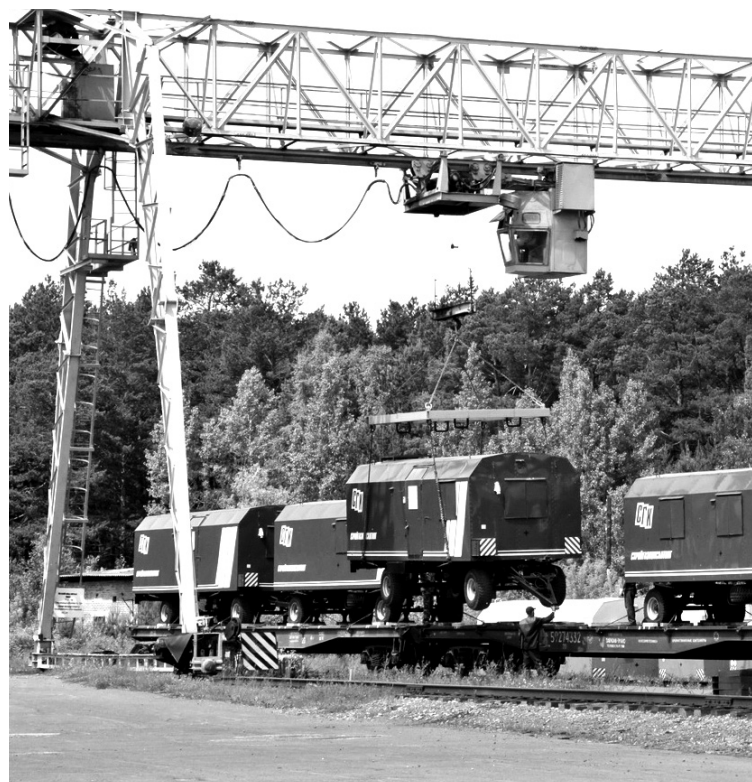
• Вагончики, во внутренней отделке которых использован стекломагнитный лист, ненамного дороже обычных.

В Тюменской области построена электростанция, работающая от солнца. Находится она в Ярковском районе и обеспечивает электроэнергией частное рыбное хозяйство. Мощность электростанции – 10 кВт. Электроэнергия она вырабатывает за счёт солнечных панелей. Зимой на предприятии работают азраторы – устройства, предназначенные для насыщения воды кислородом, которые потребляют довольно большое количество электроэнергии. Тем не менее мощности электростанции достаточно, чтобы обеспечить стабильное функционирование объекта.