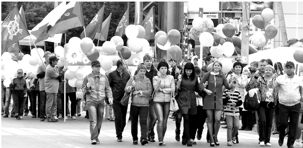
• Трудовые коллективы по традиции открывали праздник: молодёжь в первых рядах.