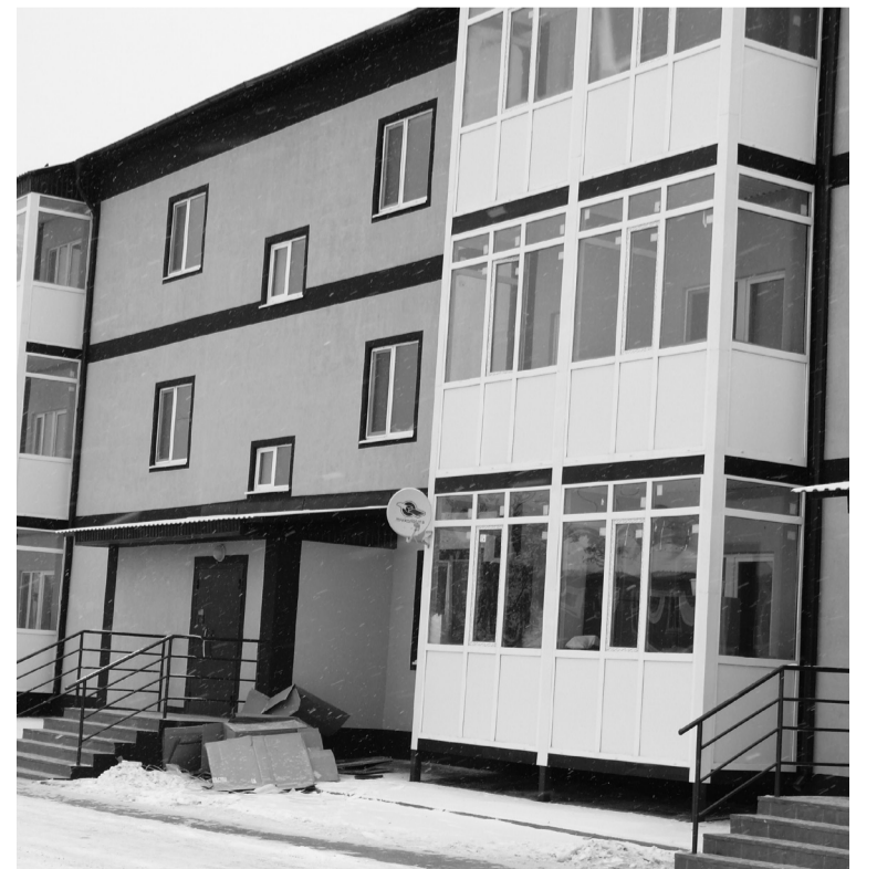
• Новая трёхэтажка украсила улицу Энергетиков.