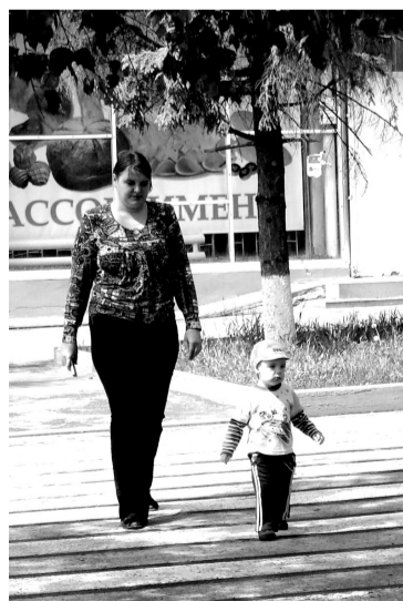
• С мамой переходить безопаснее.

– Некоторым водителям ничего не стоит проехать на красный свет светофора, а пешеходам – перебежать дорогу в неполюбованном месте.