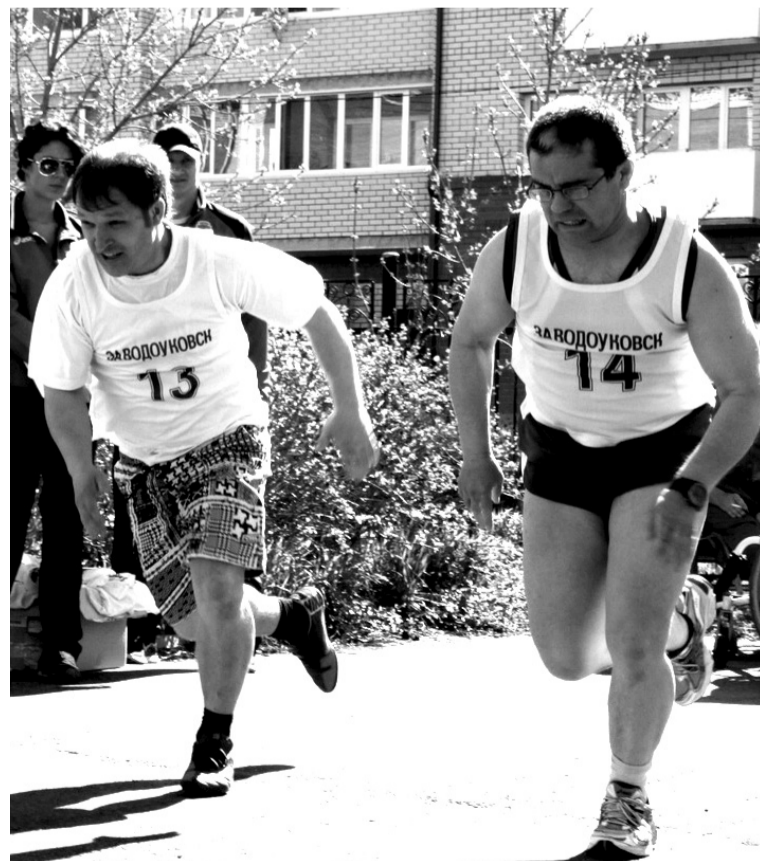
• На старте районной спартакиады инвалидов.