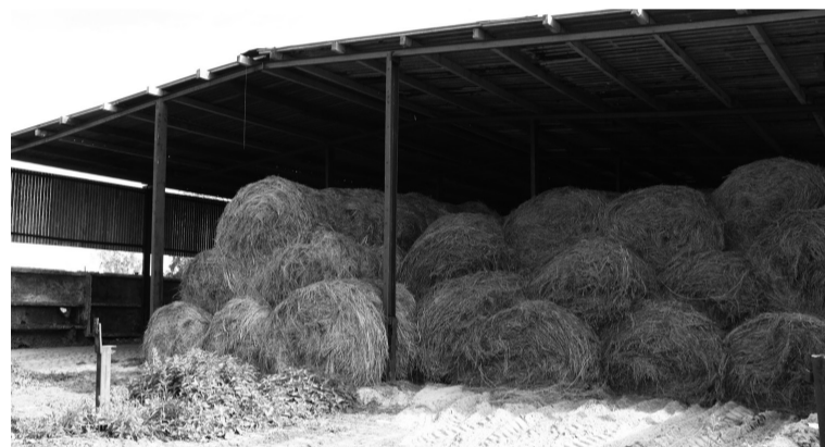
• Першинский сеновал.