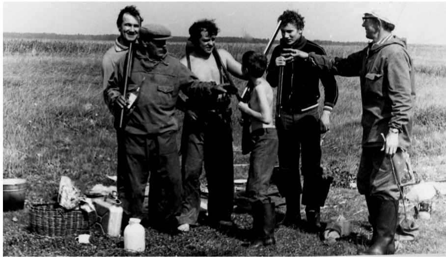
• Мужские забавы: все возрасты покорны.

Человека с ружьём на природе чаще наблюдаешь с открытием охоты на утку, с утренней зорьки в последнюю субботу августа.